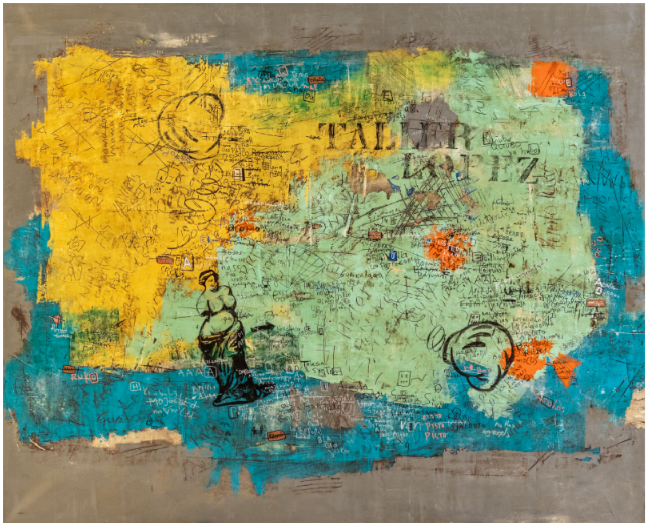
Oscar López - Gogal La banda y el ripio, De la serie: Serenata champa (2024) Mixta sobre tela 155 x 190 cm Colección del artista

"La banda y el ripio" presenta imágenes que nos remiten tanto a la historia del arte como a influencias de redes y culturas foráneas, superpuestas sobre un fondo de frases, manchas y colores que evocan los antiguos muros del centro. Todo esto confluye en el "Taller López", espacio de trabajo del artista y referencia a un negocio familiar. El título alude a la colectividad ("la banda") y a los escombros ("el ripio"): lo que sobra y se descarta.